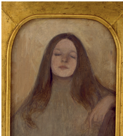
Ellen Thesleff, Thyra Elisabeth , 1892, huile sur toile, 41.5 x 34.5 cm, Helsinki Art Museum, The Katarina and Leonard Bäcksbara Collection, © Photographer Museokuva.

« De nombreux traités scientifiques du passage du siècle s'accordent à fabriquer l'existence d'une nature féminine différente et complémentaire de celle de l'homme. Un système de clivages continu : création/procréation ; production/reproduction ; sujet/objet ; actif/passif ; culture/nature ; intérieur/extérieur est au cœur de ces textes. »